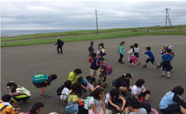
<宗谷公園へ向け出発>