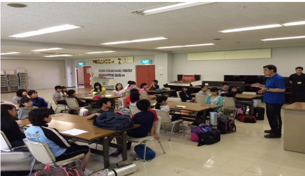
<オリエンテーション>